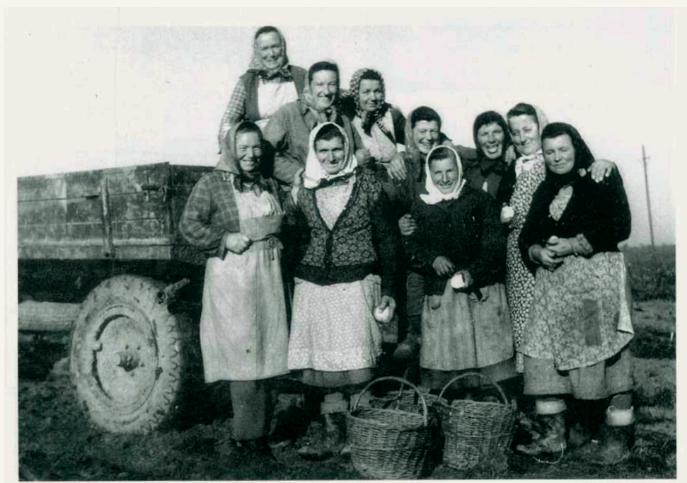
Sklizeň brambor, 50. léta