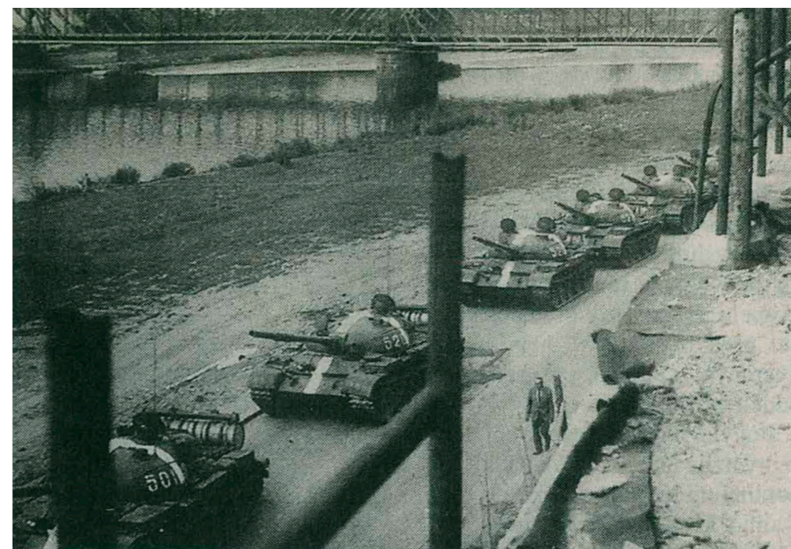
Okupace v roce 1968